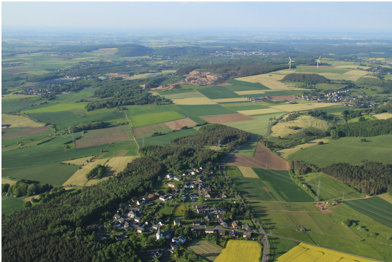
Dottel, Kallmuth und Westschacht des Erzbergbaus am Kallmuther Berg (2013)