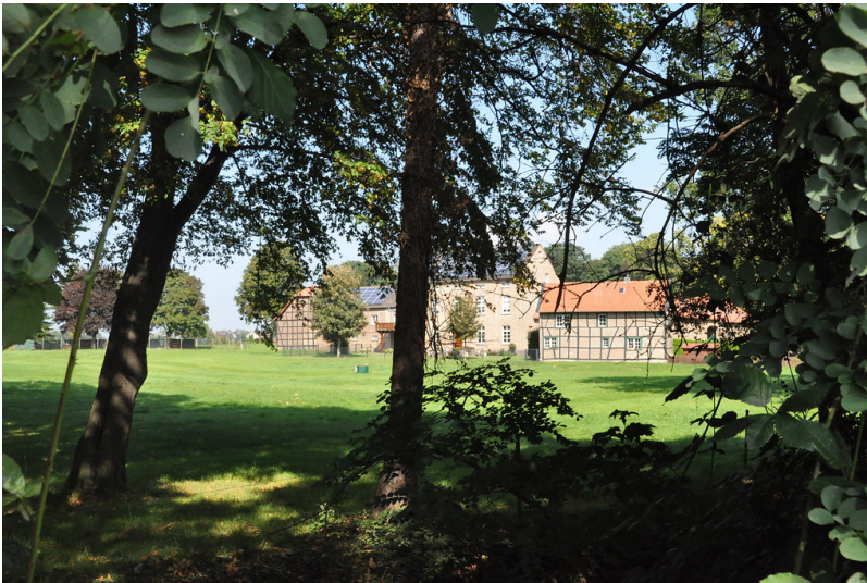
Ophof mit Wohnhaus und Fachwerkgebäuden (2014)