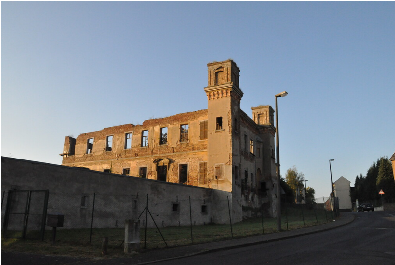
Ruine des Herrenhauses von Burg Hemmerich (2014)