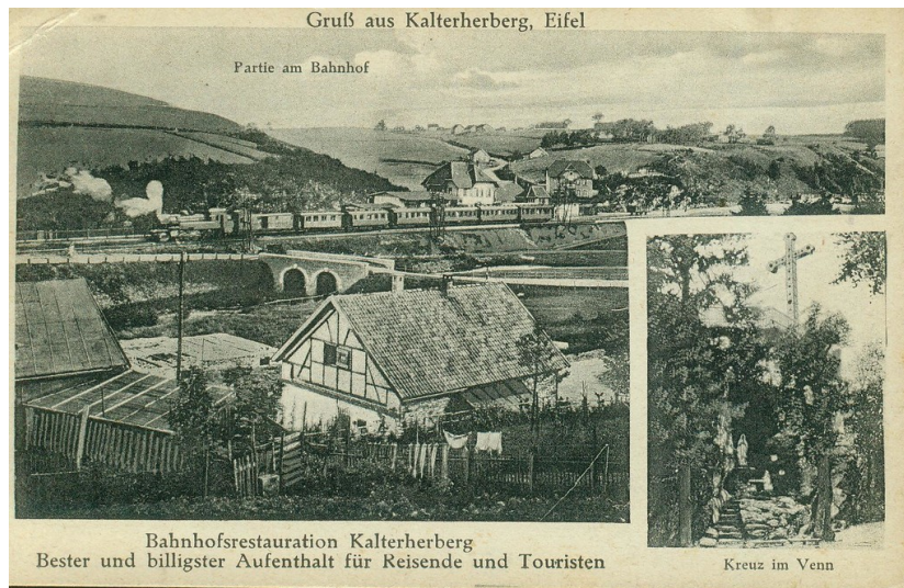
Postkarte mit touristischer Werbung aus Kalterherberg, um 1900