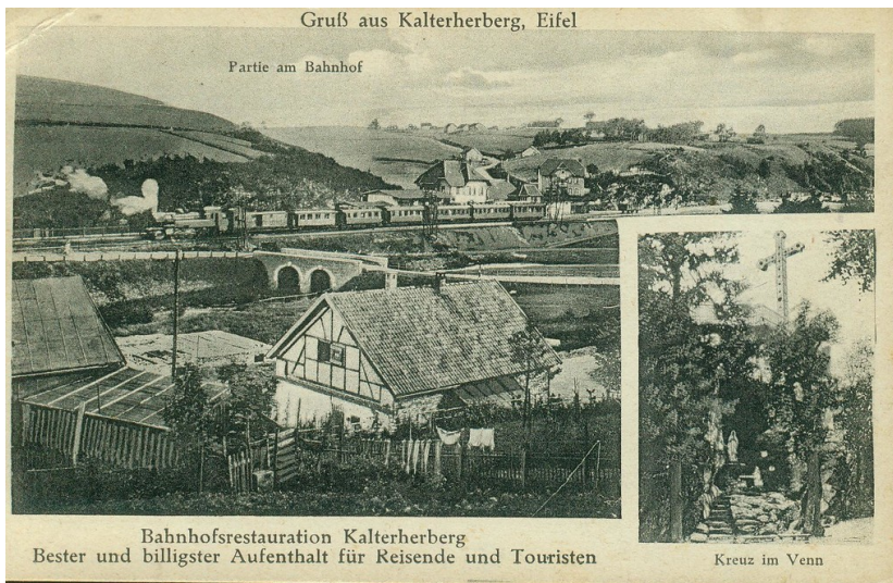
Postkarte mit touristischer Werbung aus Kalterherberg, um 1900