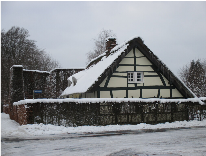
Haus mit Windschutzhecke in Höfen (2015)