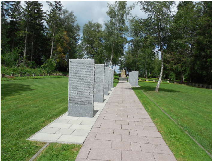
Sowjetische Kriegsgräberstätte in Simmerath-Rurberg (2020)