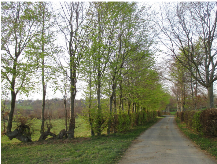
Weg zwischen Buchenhecken bei Simmerath (2015)