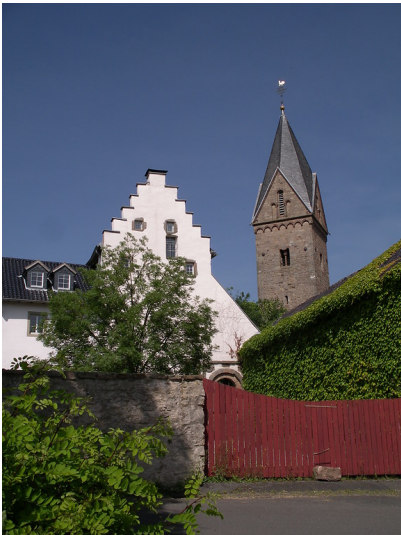
Kirchturm St. Georg und Burg Kallmuth (2018)