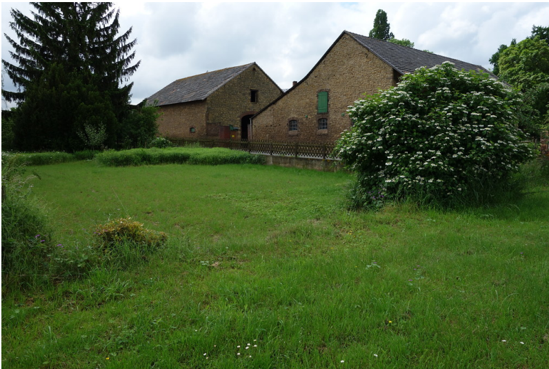
Gebäude der Achmer Mühle bei Floisdorf (2016)