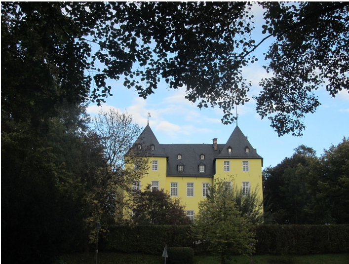
Schloss Alfter (2014)