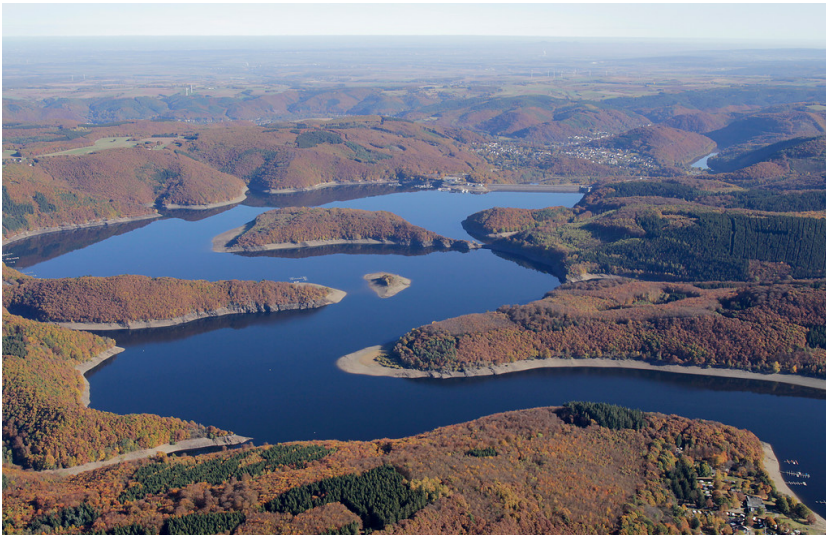
Rurtalsperre (2016)