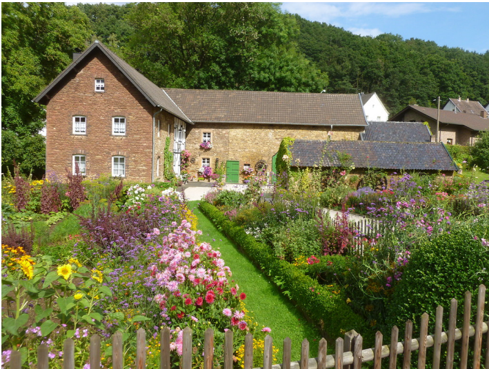
Falkensteinsmühle in Eiserfey