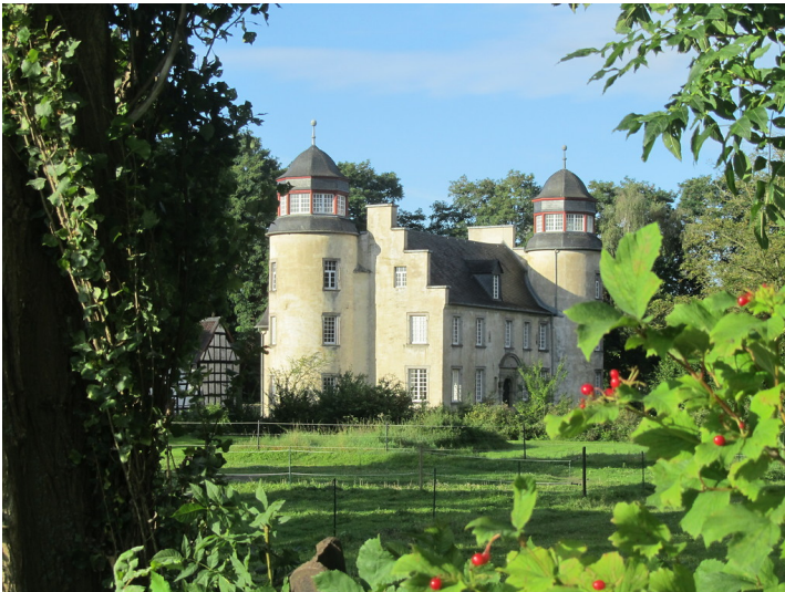
Haupthaus der Schallenburg (2014)