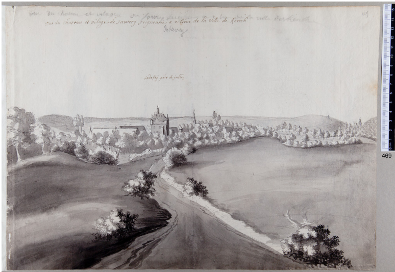
Mechernich-Satzvey, Ortsansicht, Zeichnung von Renier Roidkin Fotograf/Urheber: Renier Roidkin