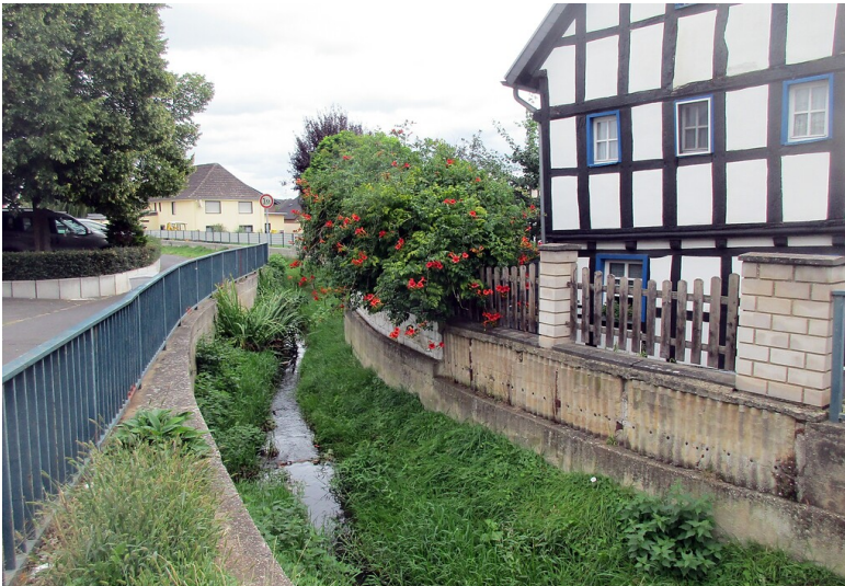
Der entlang der Straße "Im Hofpesch" durch den Ort Mechernich-Kommern fließende Bleibach (2020).