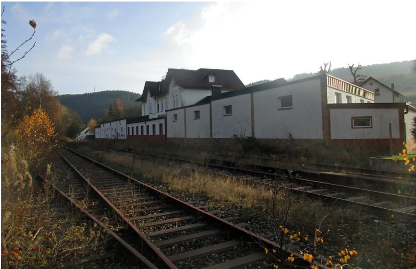
Haupt- und Nebengebäude des Bahnhofs Hellenthal der Oleftalbahn, rückwärtige Ansicht von den Gleisanlagen aus (2016).