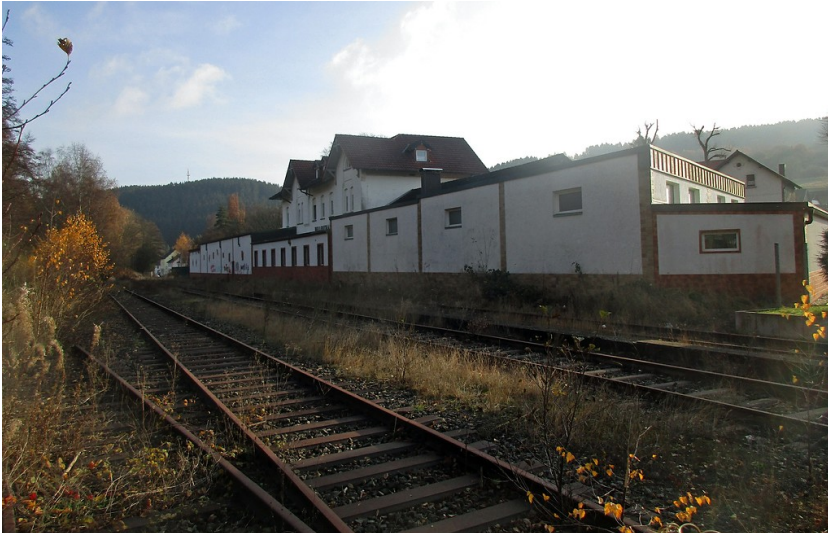
Haupt- und Nebengebäude des Bahnhofs Hellenthal der Oleftalbahn, rückwärtige Ansicht von den Gleisanlagen aus (2016).