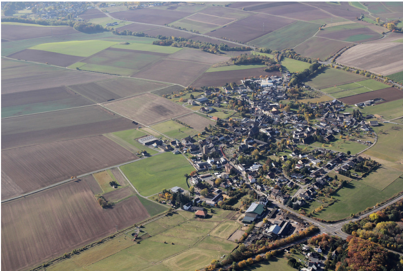
Wollersheim (2016)