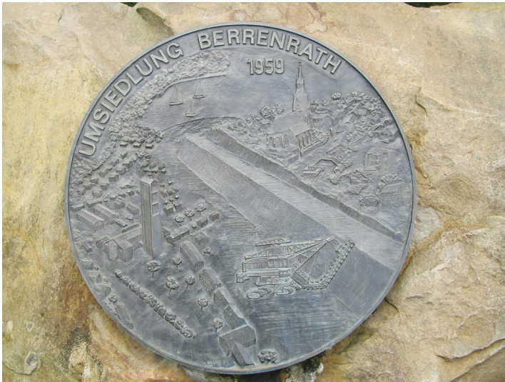
Gedenktafel Umsiedlung Berrenrath (2014)