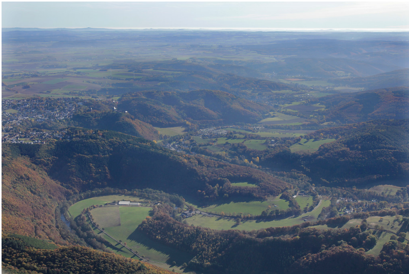
Tal der Rur bei Nideggen (2016)