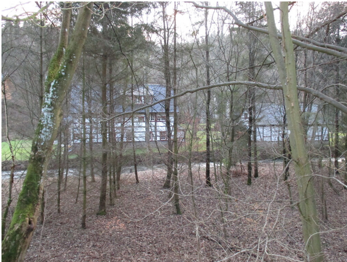
Gebäude auf dem Areal des ehemaligen Hüttenwerks Zweifallshammer (2015)