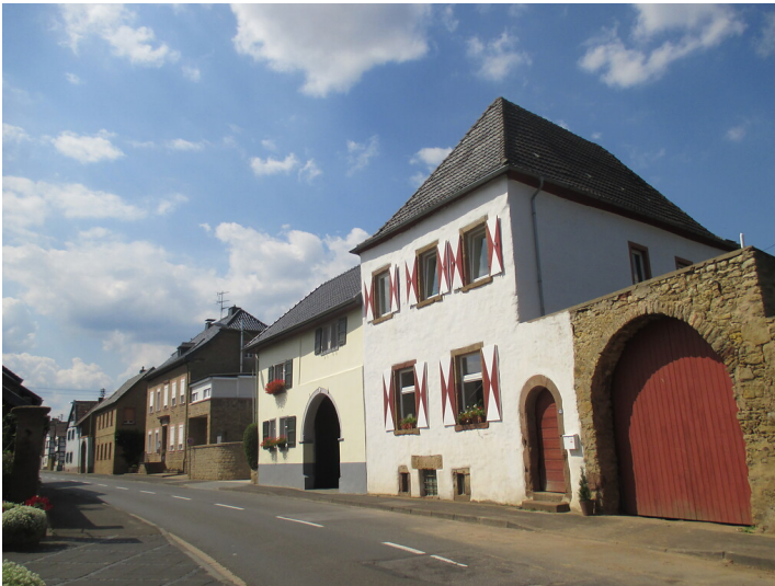
Straßenzeile in Embken mit weiß gestrichenem Herrenhaus eines ehemaligen Gutshofes und Hofmauer mit Rundbogentor und Fußgängerforte (2015)