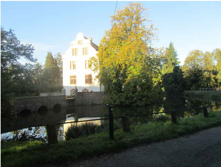
Herrenhaus von Burg Metternich im Morgenlicht (2014)