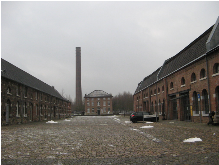
Zinkhütter Hof (2014)