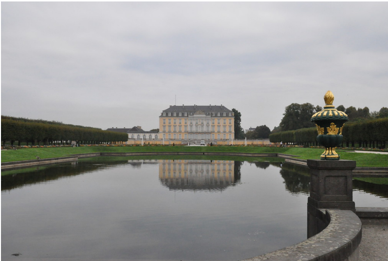
Schloss Augustusburg mit Spiegelweiher (2014)