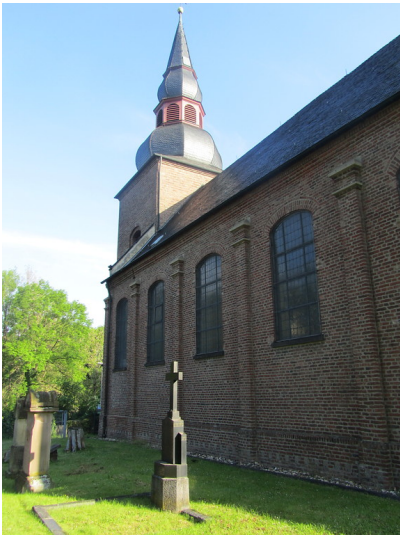
St. Mauritius in Frechen-Bachem mit alten Grabkreuzen (2014)