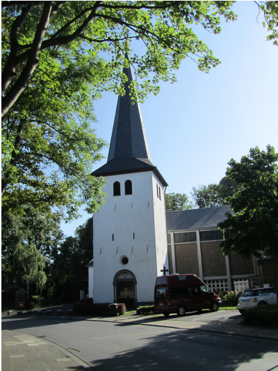
Kirchturm der Katholischen Kirche Sankt Johann Baptist in Kendenich (2014)