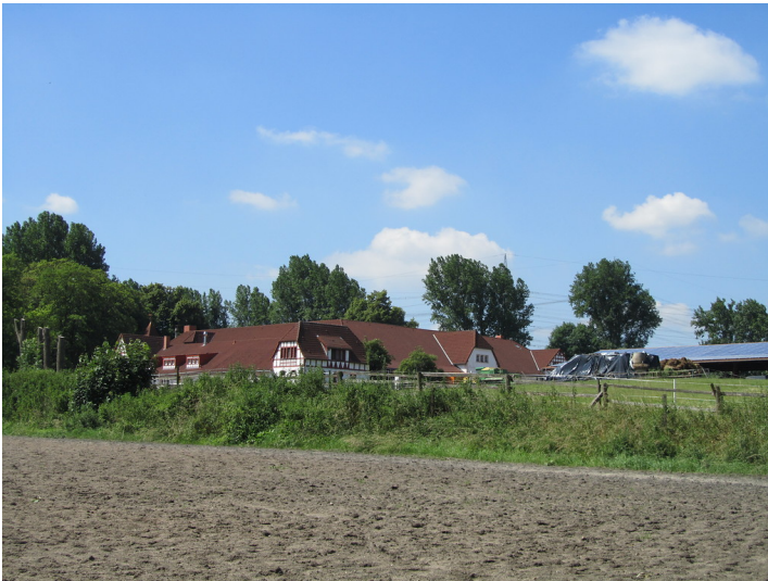
Blick auf den Vierseithof Weilerhof in Fischenich (2014)