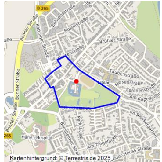
Kartenhintergrund: © Terrestris.de 2025, oder Heuss-Strasse

Schloss Gracht in Liblar ist hier beschrieben als bedeutsamer Kulturlandschaftsbereich (KLB) wie im Fachbeitrag Kulturlandschaft zum Regionalplan Köln. Die wertbestimmenden Merkmale der historischen Kulturlandschaft werden für die Maßstabsebene der Regionalplanung kurz zusammengefasst und charakterisiert.