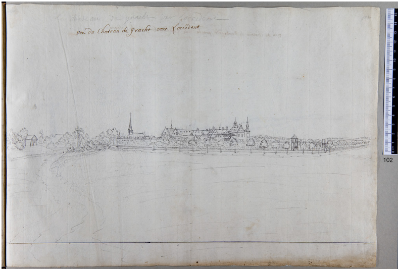
Gracht bei Liblar, Ortsansicht, Zeichnung von Renier Roidkin Fotograf/Urheber: Renier Roidkin