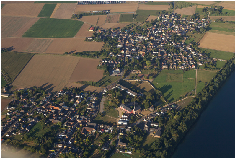
Blick auf Füssenich, das Prämonstratenserinnenstift sowie Geich in Richtung Nordosten (2016)