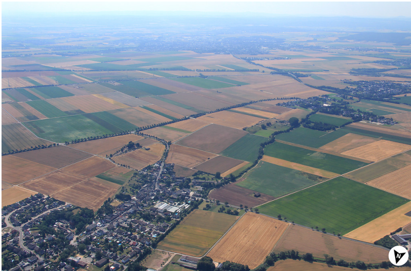
Luftbildaufnahme über die Rotbachaue mit Wichterich mit Nordpfeil (2013)