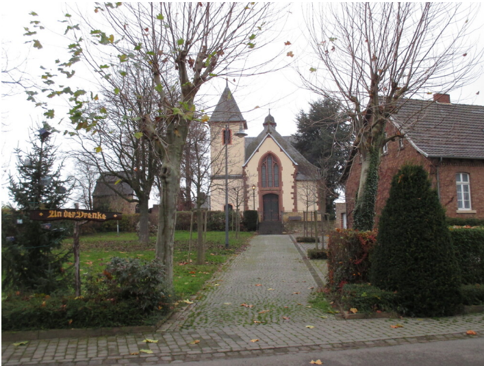
Katholische Pfarrkirche St. Severin in Merzenich (2014)