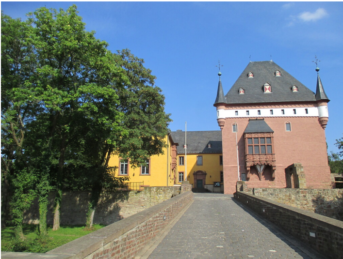
Schloss Burgau (2015)