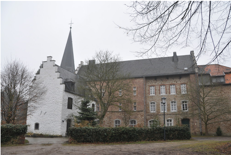
Kloster Wenau (2015)