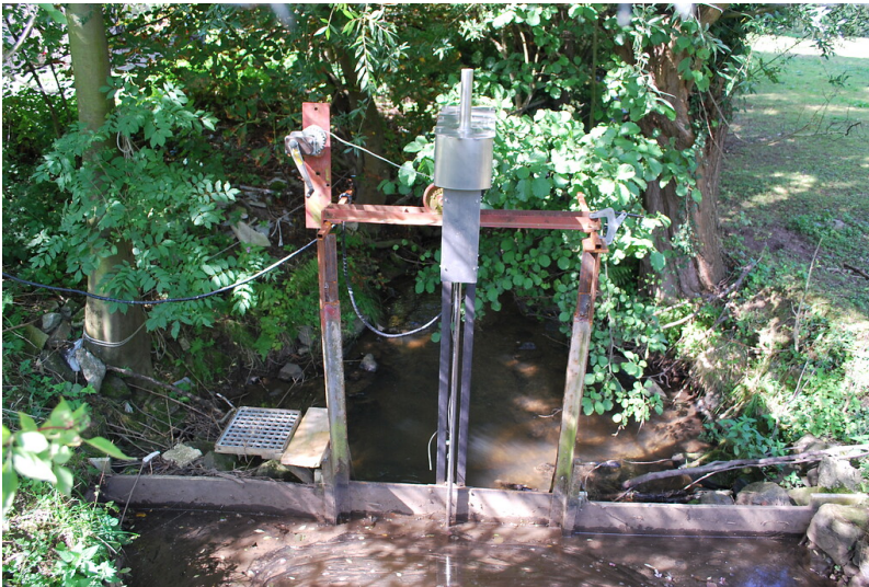
Wehr an der Gressenicher Mühle (2015)