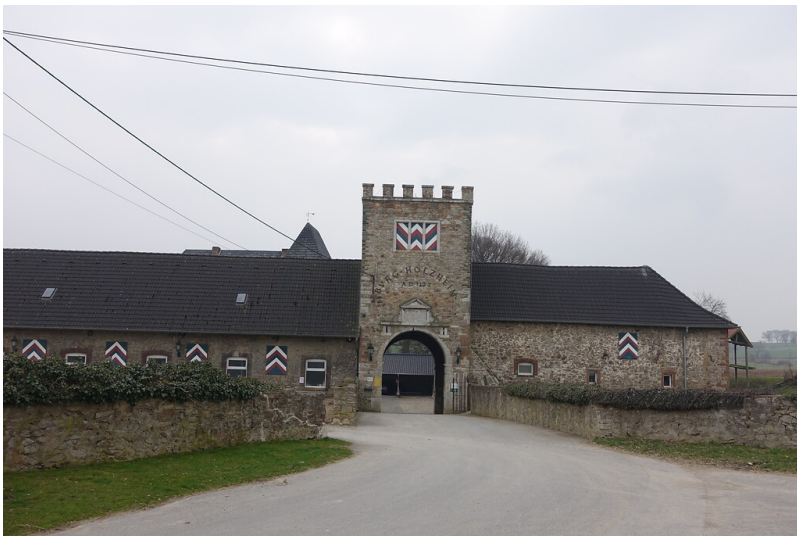
Burg Holzheim (2015)