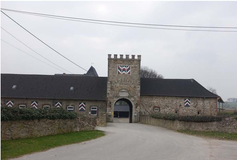
Burg Holzheim (2015)