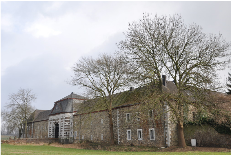
Haus Palant (2015)