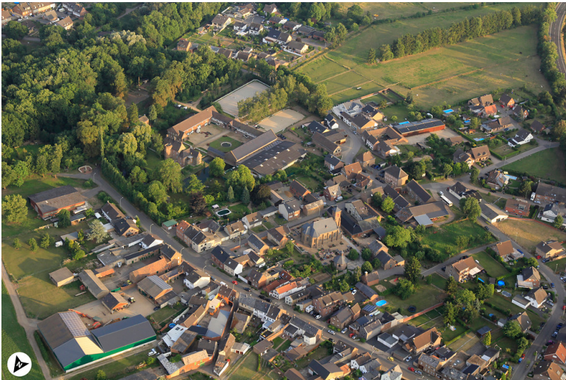
Luftbildaufnahme von Sievernich mit Burg mit Nordpfeil (2017)