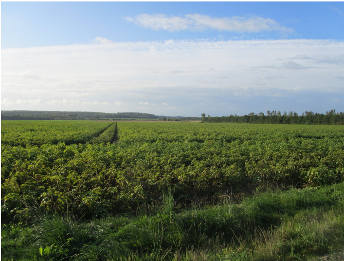
Heute landwirtschaftlich genutzte ehemalige Abbaufäche des Tagebaus Frechen (2014)