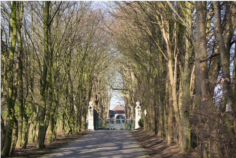
Zufahrt zu Gut Haarenheidchen (2015)