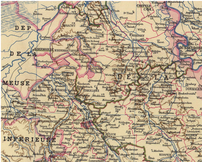
Ausschnitt aus der historischen Karte "Die Rheinprovinz unter französischer Herrschaft im Jahre 1813" (Geschichtlicher Atlas der Rheinprovinz von Wilhelm Fabricius, 1894). Fotograf/Urheber: Wilhelm Fabricius