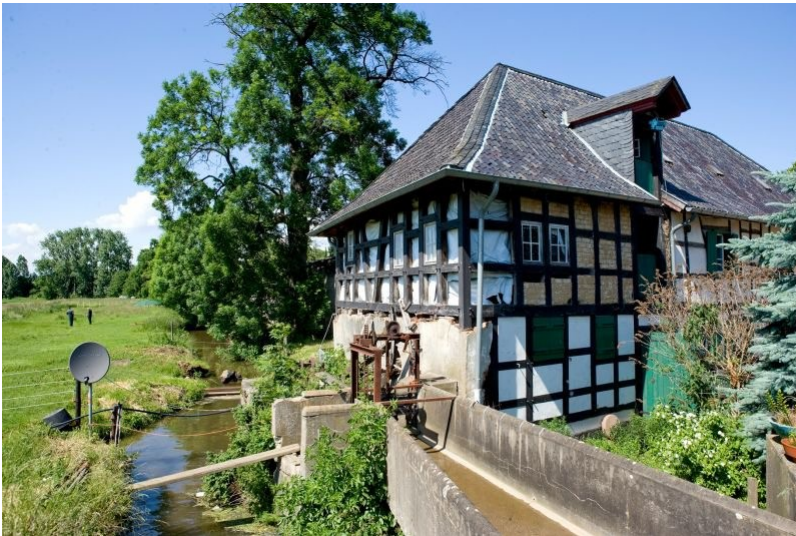
Das Fachwerkgebäude der Bliesheimer Mühle mit Mühlengraben und Zulauf