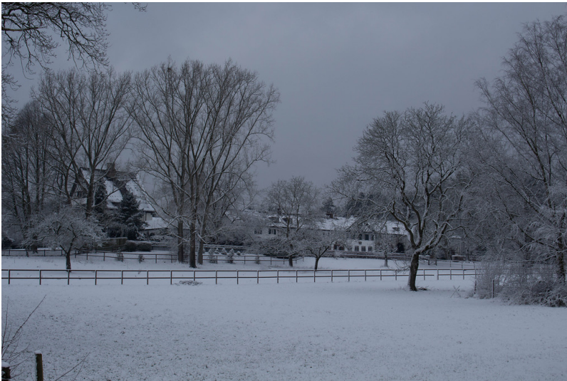
Gut Grenzhof (2015)