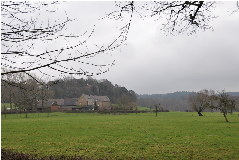
Blick auf Gut Waldhausen (2015)