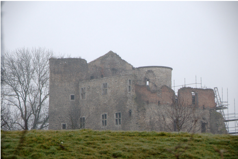
Burg Nothberg (2015)