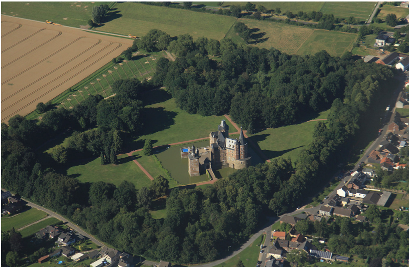
Schloss Merode (2013)