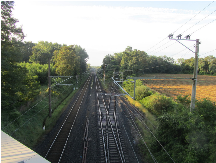
Trasse der Nord-Süd-Kohlenbahn bei Frechen (2014)