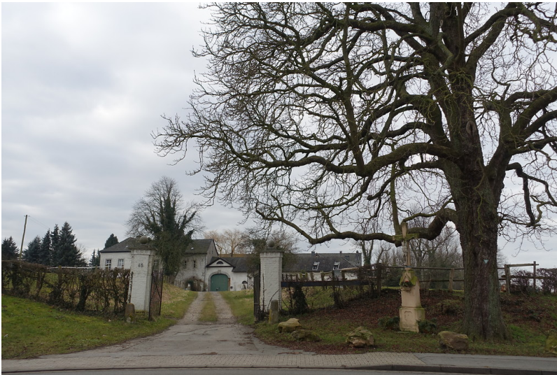
Gut Berger Hochkirchen (2015)