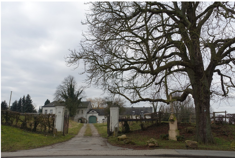
Gut Berger Hochkirchen (2015)